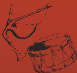
fig 5º FESTIVAL INTERNACIONAL DE GIGANTES Pinhal Novo, Portugal 1, 2 e 3 Julho 2005